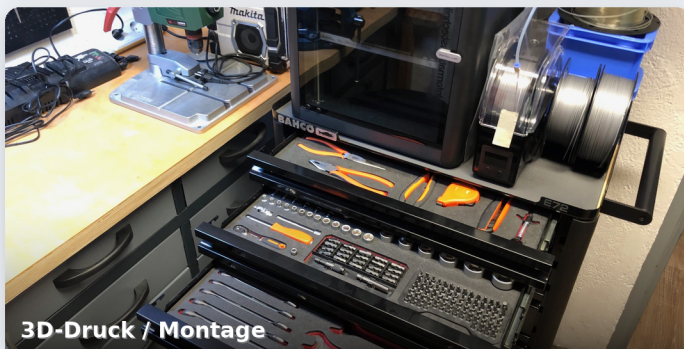
3D-Druck / Montage