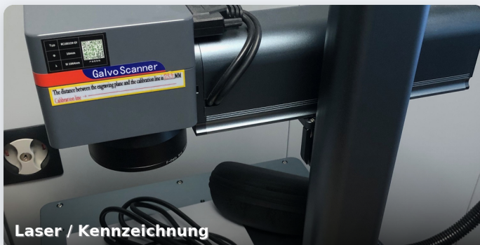
Laser / Kennzeichnung

Eigene Infrastruktur für Entwicklung, Musterbau und praktische Umsetzung.